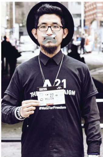
WALK FOR FREEDOM