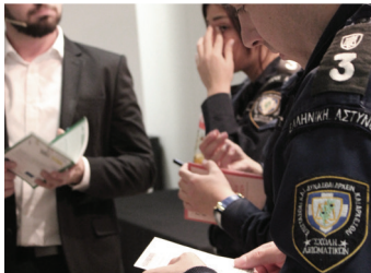
POLITIOPLÆRING I HELLAS

A21 har utviklet en effektiv, fire-delt respons til menneskehandel: Forebygging (bevisstgjøring og undervisning), Beskyttelse , Straffeløpfølging og Samarbeidspartnere . Gjennom denne tilnærmingen skaper vi en bevissthet som forbygger fremtidig menneskehandel, straffeløpfølger gjerningsmenn og gir ettervern og rehabilitering av ofre.